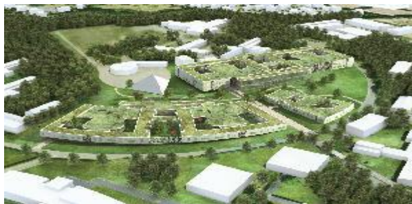
Etablissement Public de Santé Mentale de la Sarthe

L'Institut de formation en soins infirmiers est situé à l'intérieur de l'Etablissement Public de Santé Mentale de la Sarthe, sur le site d'ALLONNES, ville distante d'environ 7 km du centre de la ville du MANS et très bien desservie par un réseau d'autobus rapide (tempo).